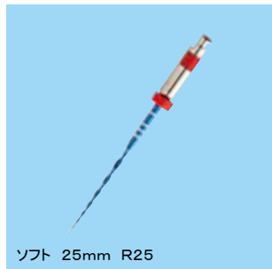
ブルー色 ソフト 実寸